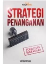
STRATEGI PENANGANAN PEMBIAYAAN BERMASALAH [HeryaMedia, 2016]