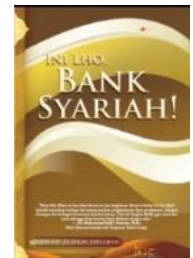
INI LHO BANK SYARIAH! [Grafindo Media Pratama, 2008]