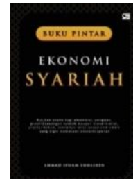
BUKU PINTAR EKONOMI SYARIAH [Gramedia Pustaka Utama, 2010]