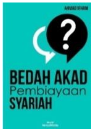
BEDAH AKAD PEMBIAYAAN SYARIAH [HeryaMedia, 2015]