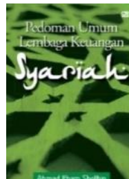
PEDOMAN UMUM LEMBAGA KEUANGAN SYARIAH [Gramedia Pustaka Utama, 2010]