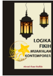
LOGIKA FIKIH MUAMALAH KONTEMPORER [ASC, 2017]