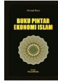
BUKU PINTAR EKONOMI ISLAM [HeryaMedia, 2017]