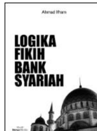
LOGIKA FIKIH BANK SYARIAH [HeryaMedia,2015]